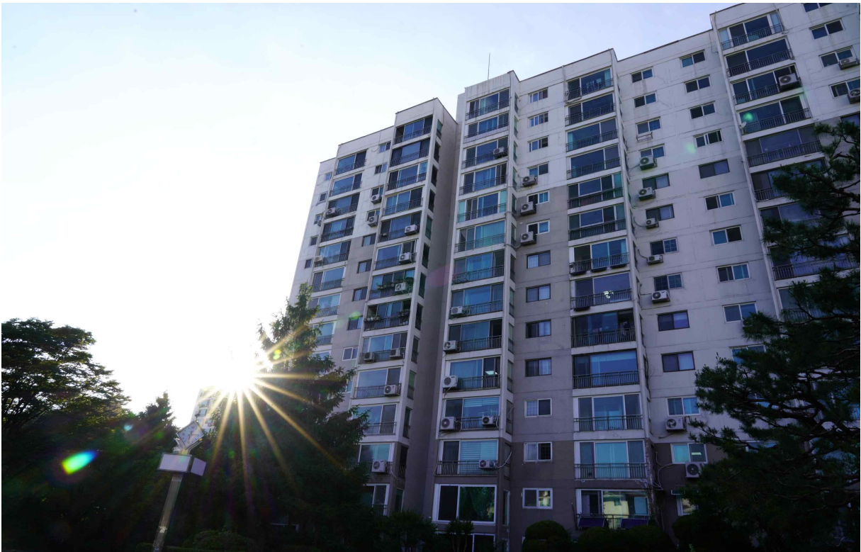
그림 7 220526 120동 앞