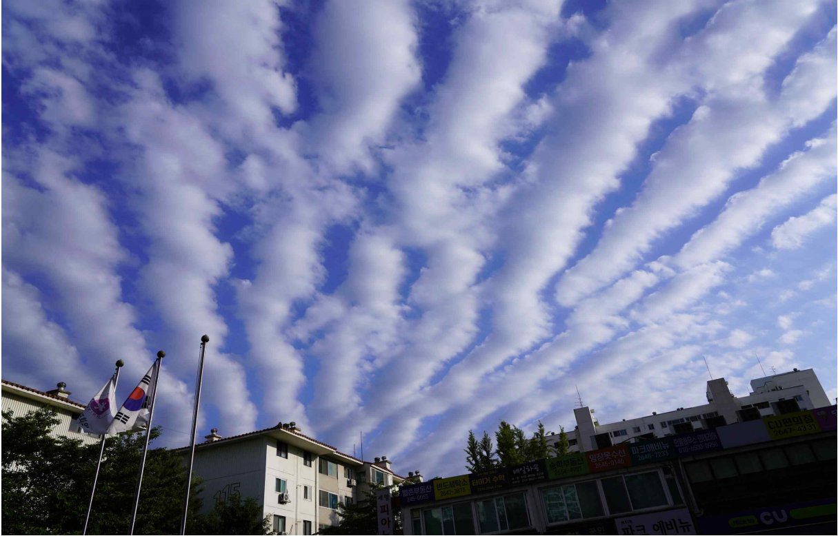
그림 6 220526 관리사무소 앞 광장