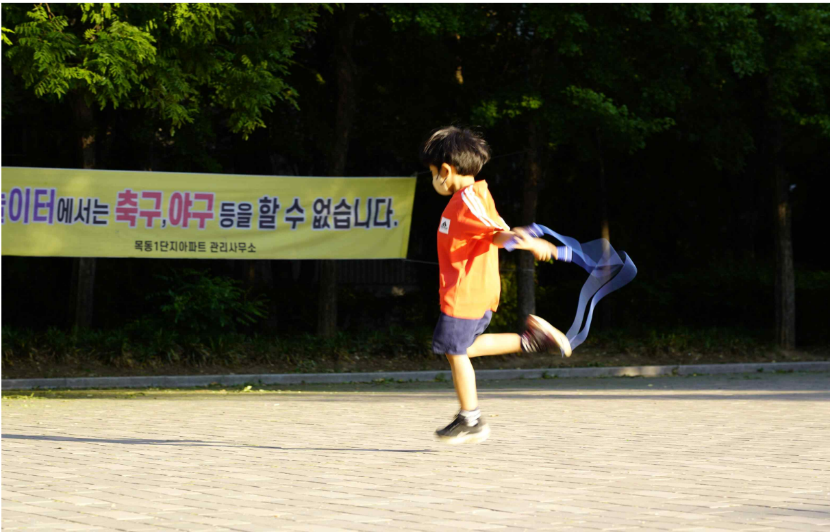
그림 3 2220526 127동앞 놀이터