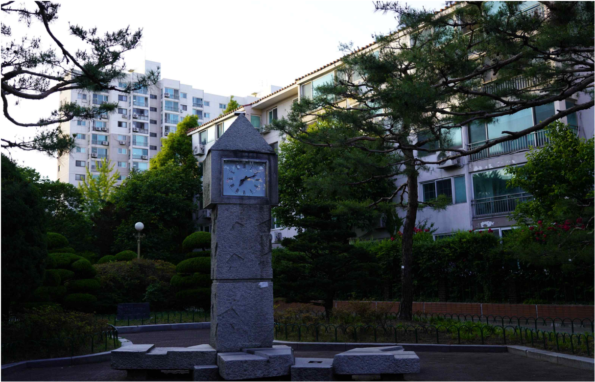
그림 4 220526 131동앞 시계탑