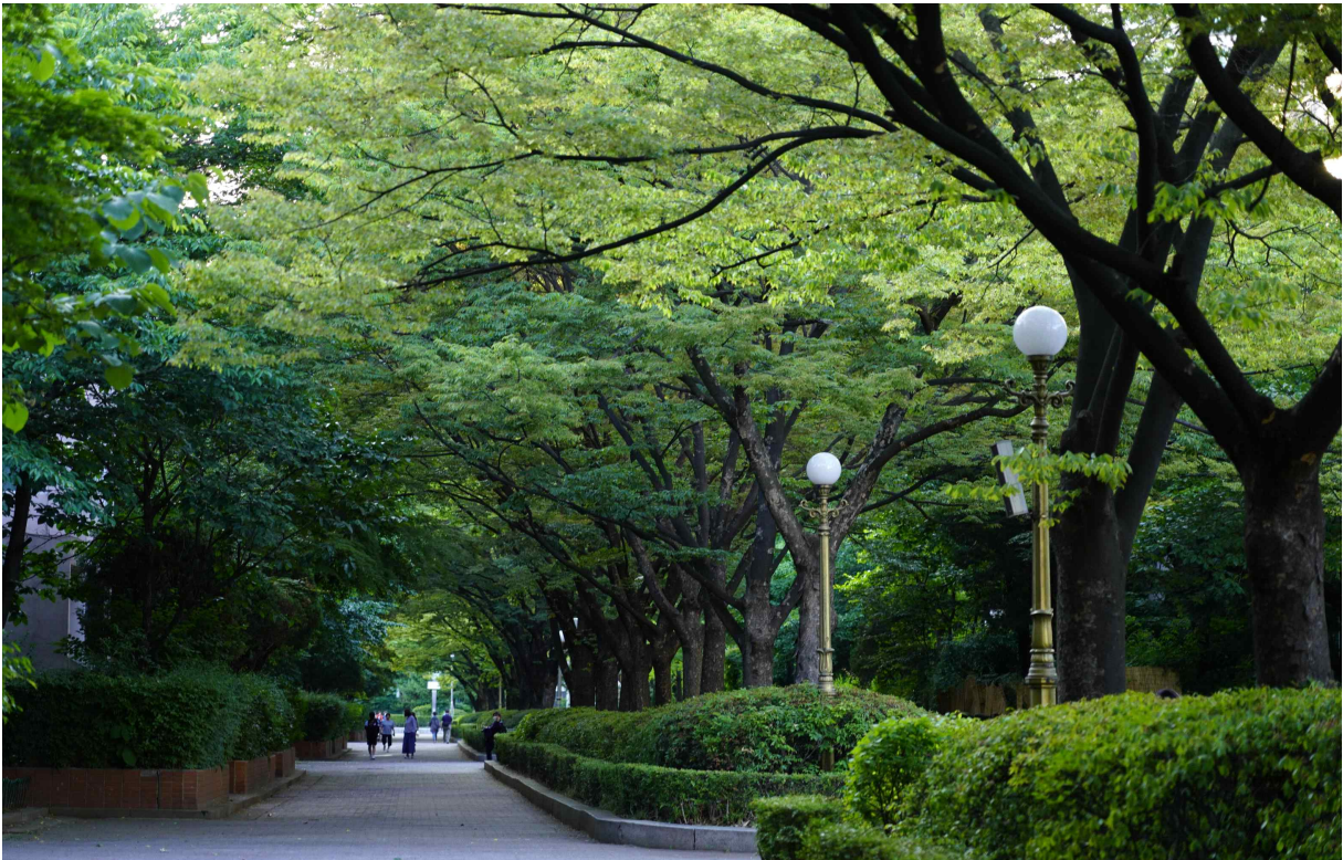
그림 5 220526 1단지 중앙로