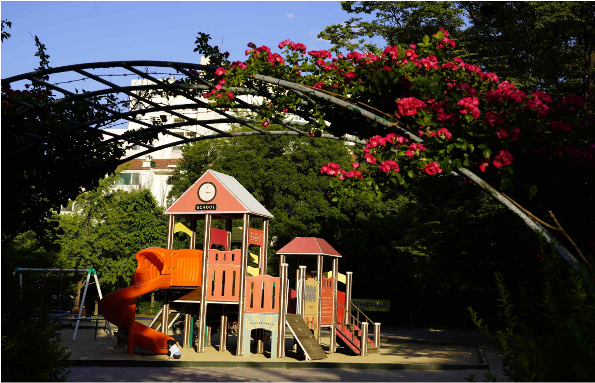
그림 2 2220526 127동앞 놀이터